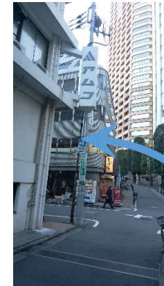
② 角の中村屋を右折