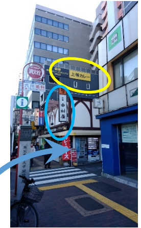
上等カレーの看板