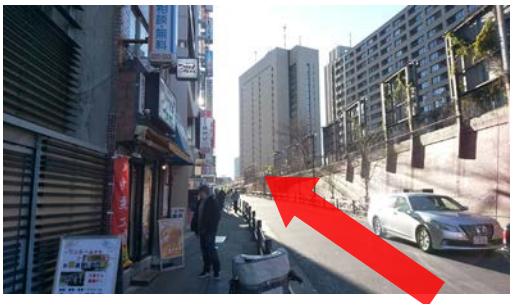
④ 線路沿いに1ブロック進む