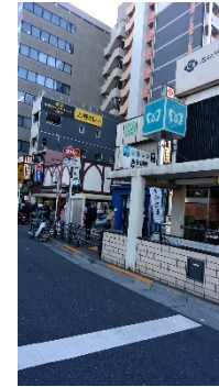
① 地下鉄飯田橋駅 A4 出口