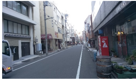
⑦ & ④ 左に日産ビル・Natuluk の看板も